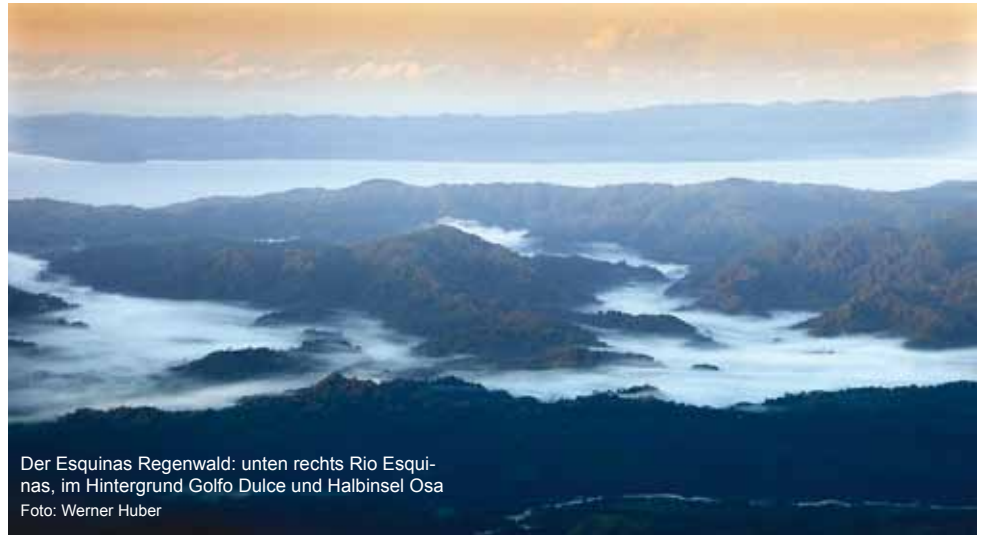
Der Esquinas Regenwald: unten rechts Rio Esquinas, im Hintergrund Golfo Dulce und Halbinsel Osa