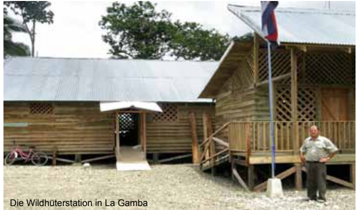
Die Wildhüterstation in La Gamba

Zugleich mit dem Freikauf des Esquinas Regenwaldes bemüht sich der Verein Regenwald der Österreicher , das Gebiet vor illegalen Holzfällern und Wilderern zu schützen und die Artenvielfalt wiederherzustellen. In enger Zusammenarbeit mit der Nationalparkverwaltung und internationalen NGOs werden Umweltschutzmaßnahmen verwirklicht. Seit 1998 hat der Verein € 200.000 für Wildhütergehälter und Tierschutzprojekte im Esquinas Regenwald gespendet.