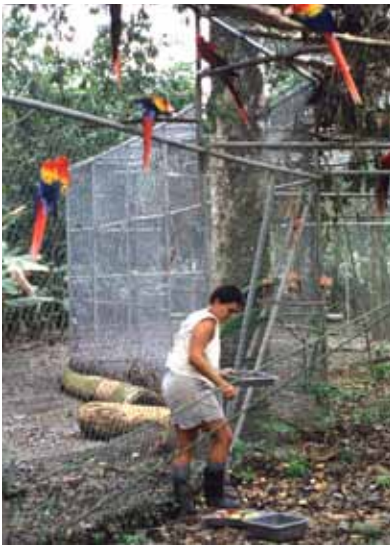
Ara-Freilassungsgehege von Zoo Ave

Zugleich mit dem Freikauf des Esquinas Regenwaldes bemüht sich der Verein Regenwald der Österreicher , das Gebiet vor illegalen Holzfällern und Wilderern zu schützen und die Artenvielfalt wiederherzustellen. In enger Zusammenarbeit mit der Nationalparkverwaltung und internationalen NGOs werden Umweltschutzmaßnahmen verwirklicht. Seit 1998 hat der Verein € 200.000 für Wildhütergehälter und Tierschutzprojekte im Esquinas Regenwald gespendet.