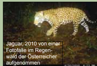
Jaguar, 2010 von einer Fotofalle im Regenwald der Österreicher aufgenommen

Im Esquinas Regenwald wurden bisher 96 Arten von Säugetieren (darunter Jaguar, Ozelot, Puma, Margay, Ameisenbär, vier Affenarten und 53 Fledermausarten), 37 Amphibien- und 42 Reptilienarten und 319 Vogelarten gezählt.