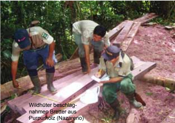
Wildhüter beschlagnahmen Bretter aus Purpurholz (Nazareno)