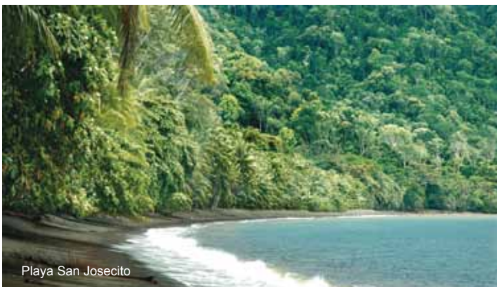
Playa San Josecito